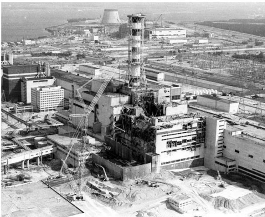
Рис.1. Чорнобильська АЕС

Вибух ядерної зброї викликає радіоактивне забруднення, яке може тривати десятиліття та впливати на здоров'я та навколишнє середовище. Чорнобильська (Рис.1) та Фукусімска катастрофи є прикладами наслідків радіоактивного забруднення.